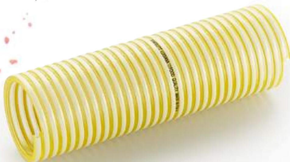
Спираль ПВХ PVC spiral